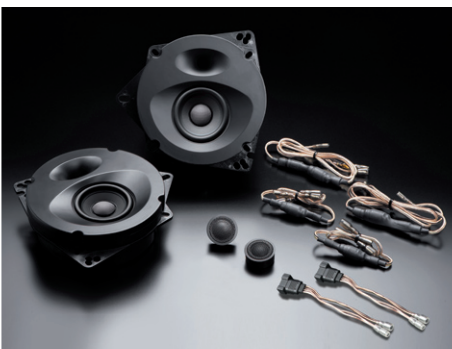
SP-AQUA2 (純正6スピーカー装着車・フロント専用)