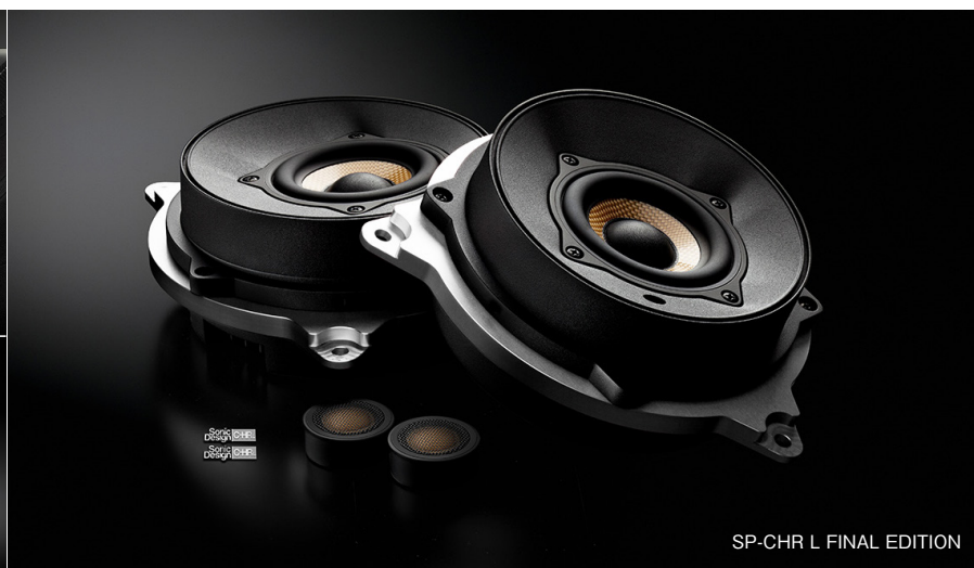
SP-CHR L FINAL EDITION

車両への装着画像(左上)は合成によるものです。製品は純正グリル内に装着されるため、実際にはスピーカーユニットは見えません。