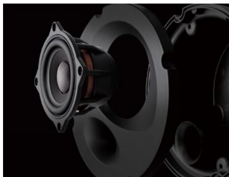
エンクロージャー一体型ウーファーモジュール