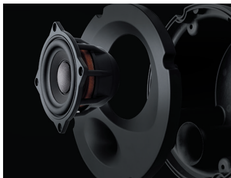
エンクロージャー一体型モジュール