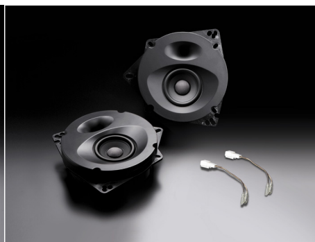
SP-ES81E (フロント / リア両用)