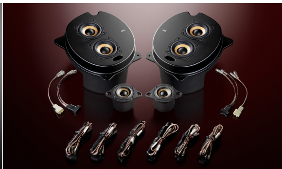
2C-P30 Double Crest (ネットワーク付属)