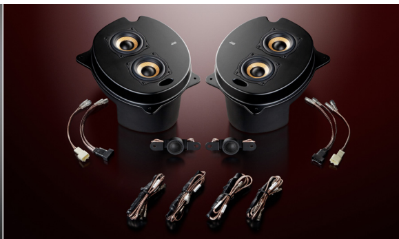
1C-P30 Single Crest (ネットワーク付属)