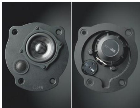
具有优秀防震&调音效果的调音机型（图为SP-639M）