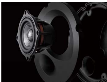
密闭一体式低音单元