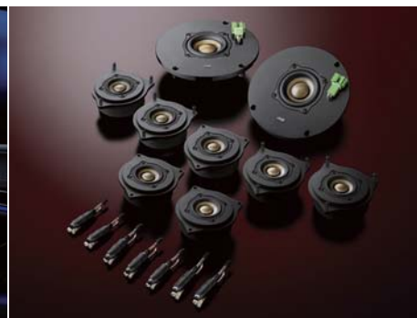
3C-222 Triple Crest扬声器套装