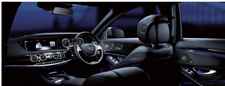
安装效果图（图片为合成图）