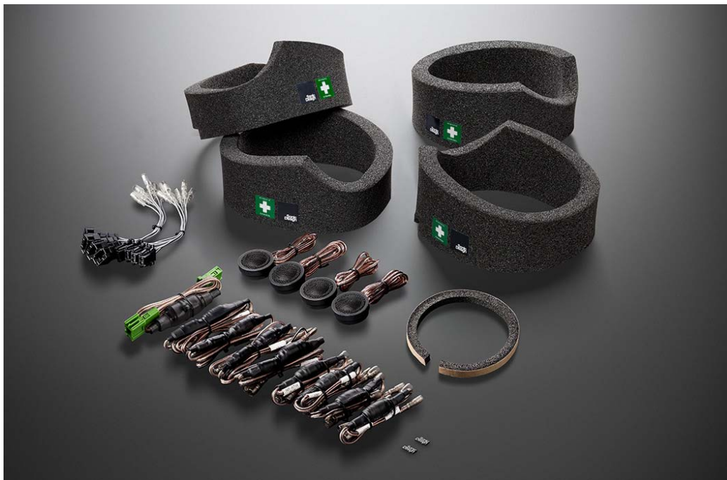
「Sonic Design Sound Suite」新款 GLA/GLB 车专用套装