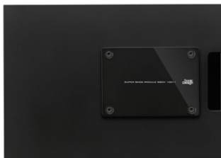
B80N 77mm スーパーバスモジュール